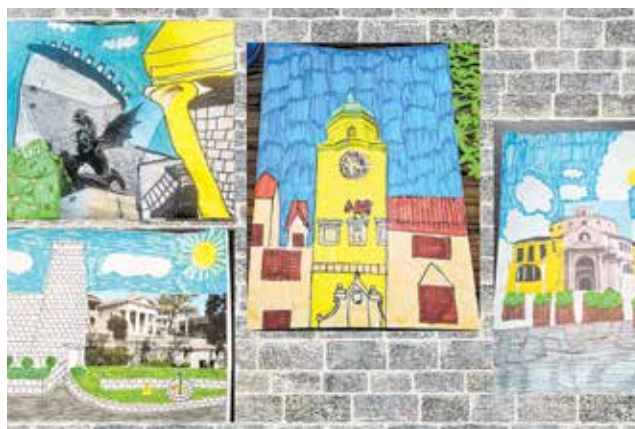
Ovo djelo se zove »Znamenitosti Rijeke«